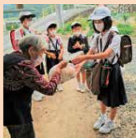
美川地区社協 一人暮らし高齢者訪問