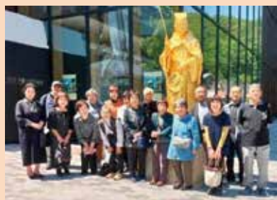
西川面いきいきサロン