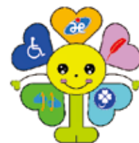
イメージキャラクター「ラブらん」