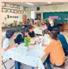
山田地区社協 やまびーカフェ