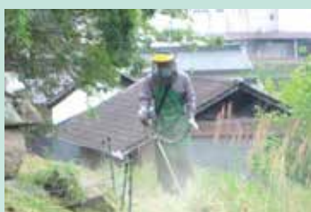
【ボランティアによる草刈り】

毎戸町内会では、高齢者が今までの経験、知識、技能を活かす機会を作り、活動する人も依頼する人も元気になるよう「地区ボラン