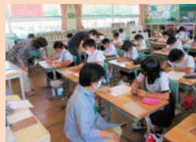
やかげ点訳サークル