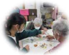
障がい者施設での活動