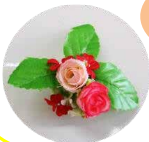
マグネット 花飾り