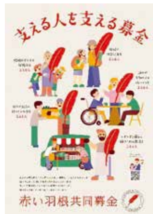
共同募金ポスター2025