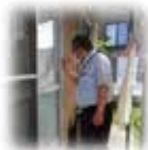
③ 利用者訪問、お金の受け 渡し、生活状況の確認