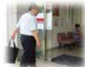
② 金融機関で 出金