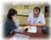
① 社協職員と 出金額の確認

日常生活自立支援事業 とは、 判断能力に不安がある方のお手伝い (福祉サービスの手続き・お金の管理・ 大切な書類の預かり) をする事業です。