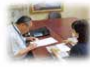
⑤ 社協職員への 本日の報告