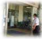
④ 医療機関等の支払い